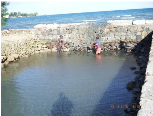
Bassin de captivité

Durant le festival des baleines, la remise en liberté de six tortues marines retenues dans un bassin non appropriée à Ambodifotatra était effectuée avec l'appui de CETAMADA, et cela grâce à l'intervention de Mr le Ministre de l'Environnement, de l'Écologie, de la Mer et des Forêts auprès du propriétaire. En effet, l'observation des tortues marines dans un cadre d'activités écotouristiques est plus viable économiquement, tout en assurant la conservation de ces espèces emblématiques.