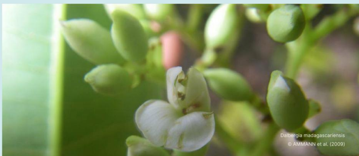
Dalbergia madagascariensis © AMMANN et al. (2009)

Les activités génératrices sont également respectueuses de l'environnement. Les cultures de maïs qui constituent une menace majeure des ressources forestières de l'ouest ne sont pas éligibles comme AGR dans les sites d'intervention de cette région. Les emplois des pesticides et/ou engrais chimiques sont, pareillement, limités. L'utilisation de composts et pesticides naturels est vulgarisée. Les usagers s'engagent dans la réalisation des actions de conservation des espèces cibles et se tiennent à un plan de travail annuel concernant leurs mises en œuvre et le bon fonctionnement des activités génératrices de revenus.